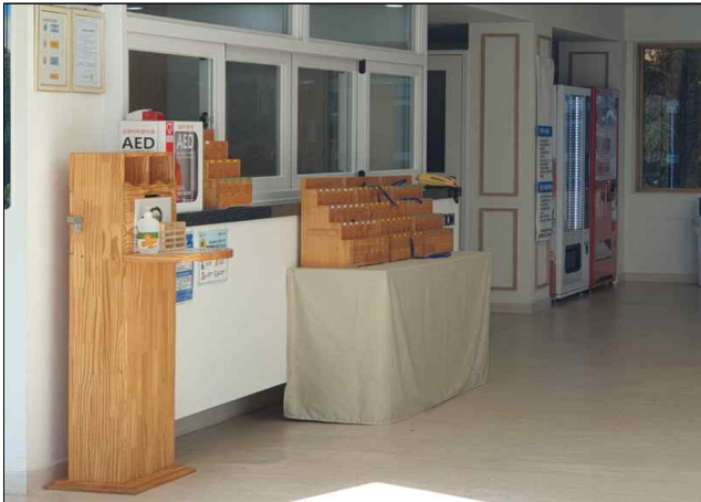
생활관 1층 프론트