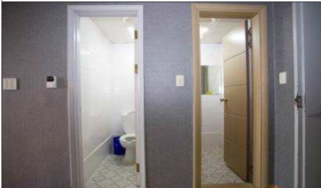
생활관 내 화장실, 샤워실