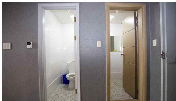
숙소 내 화장실·샤워실