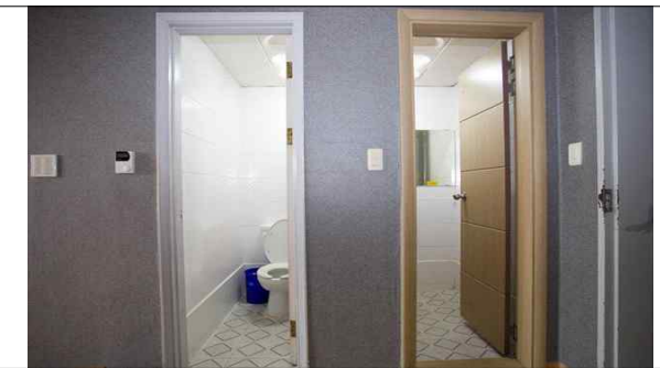
숙소 내 화장실·샤워실