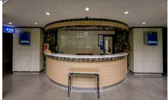
생활관 1층 프론트