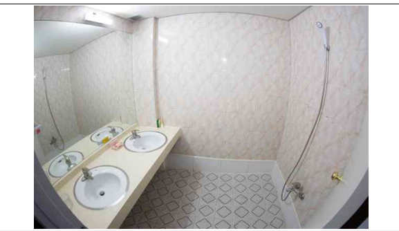
숙소 내 세면장